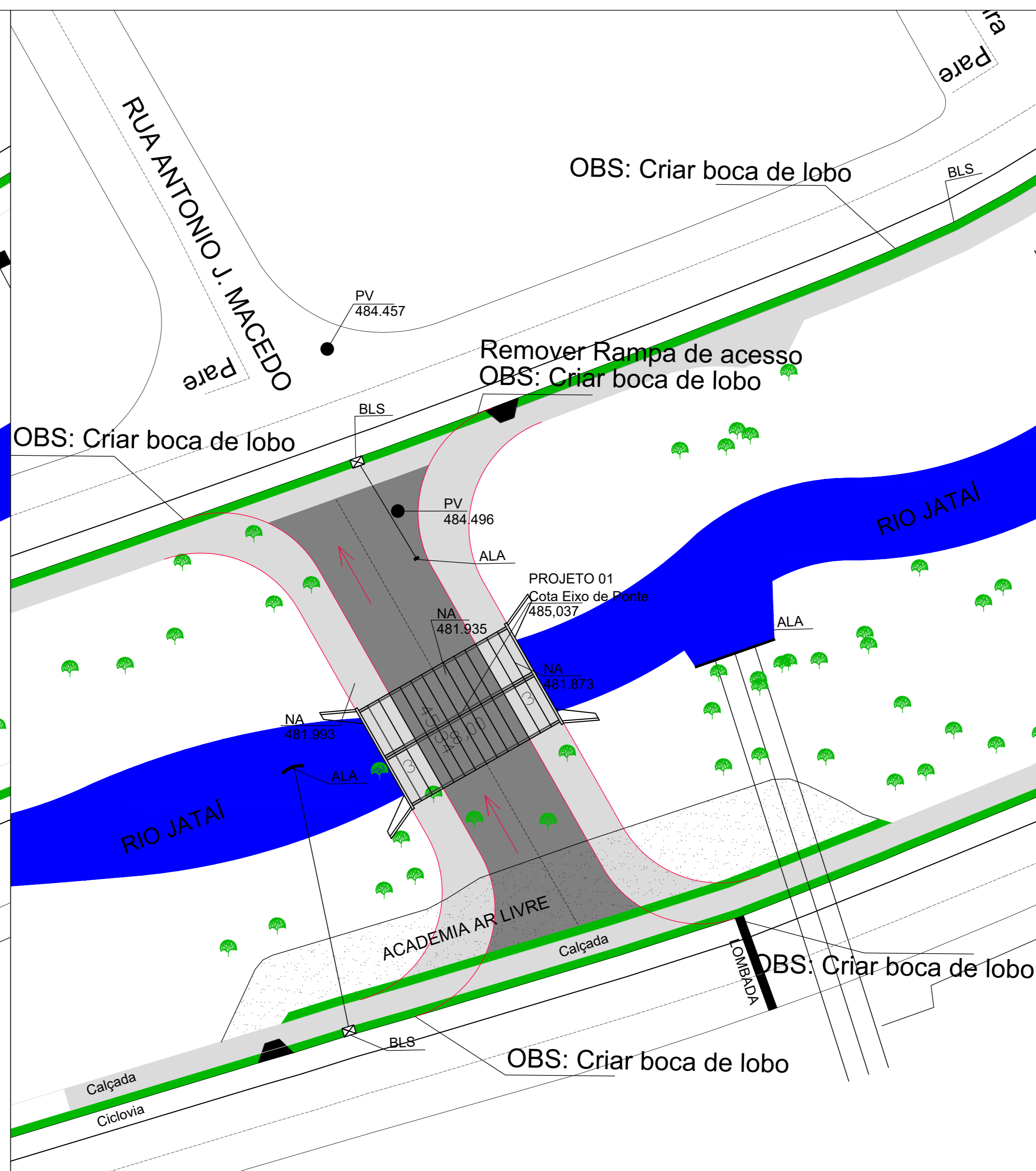
PLANTA BAIXA - LEVANTAMENTO TOPOGRÁFICO ESCALA: 1:100