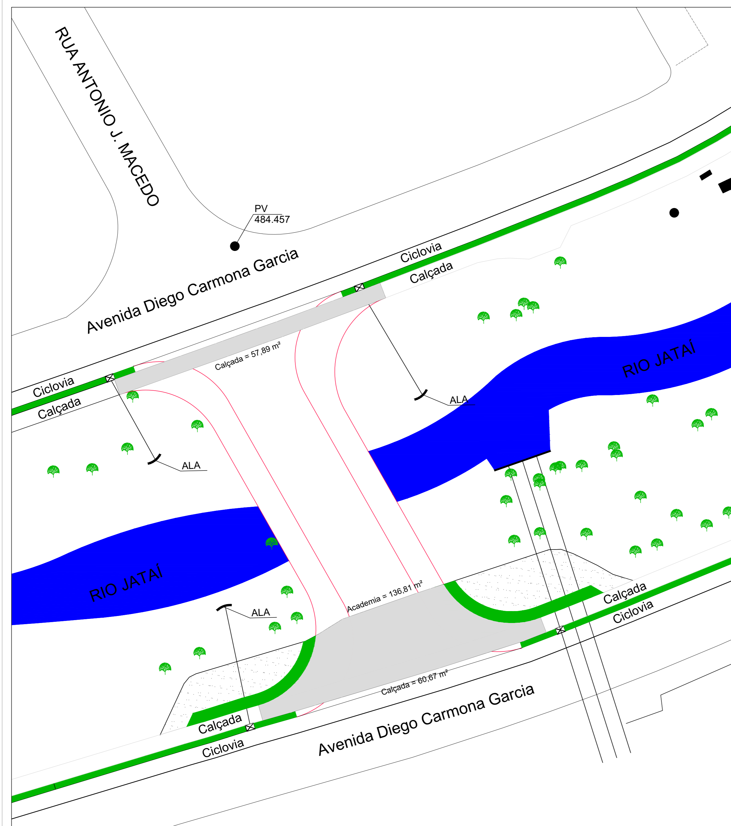
PLANTA BAIXA - PONTE - DEMOLIÇÃO CONCRETOS ESCALA: 1:100 DEMOLIÇÃO DE CALÇADA E CONCRETAGENS CONCRETAGENS - ACADEMIA = 136,81 m² CALÇADAS = 118,56 m